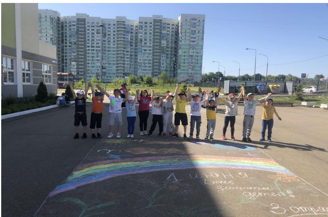
Конкурс рисунков на асфальте «Моё счастливое детство» 01.06.2022