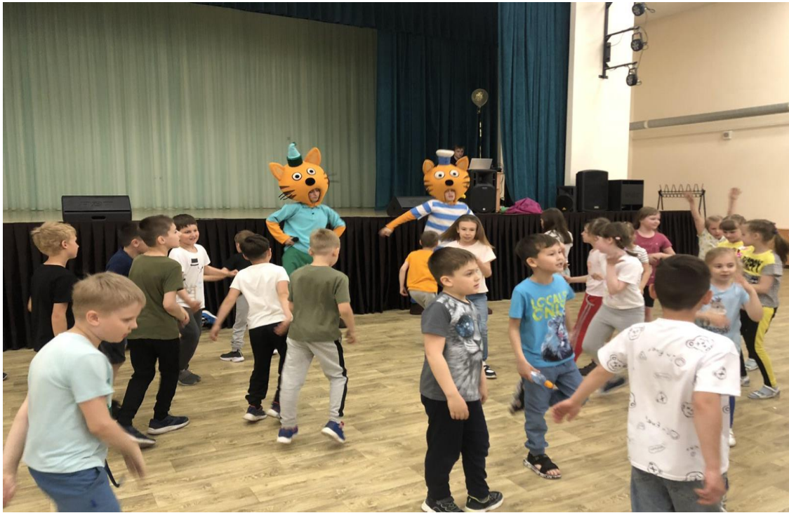
«Три кота» развлекательно-познавательная программа.